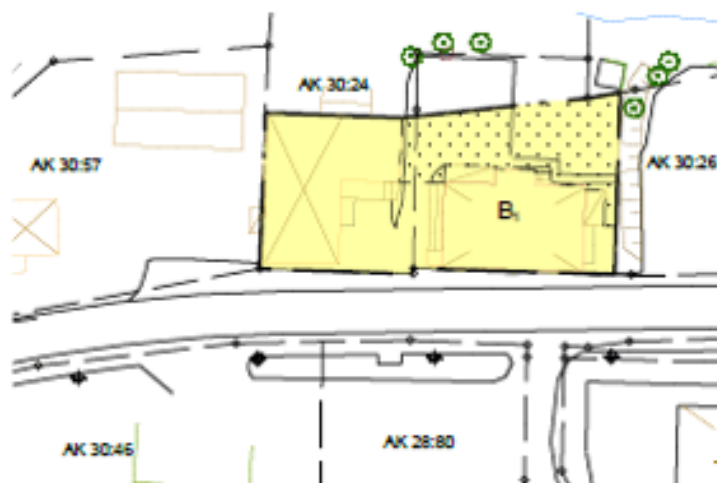
Figur 3: Utdrag ur plankarta

Inga nya bestämmelser införs inom det ändrade planområdet. De delar av bestämmelserna som upphävs är de som begränsar antalet tillåtna lägenheter och i vilka byggnader lägenheter får inredas.