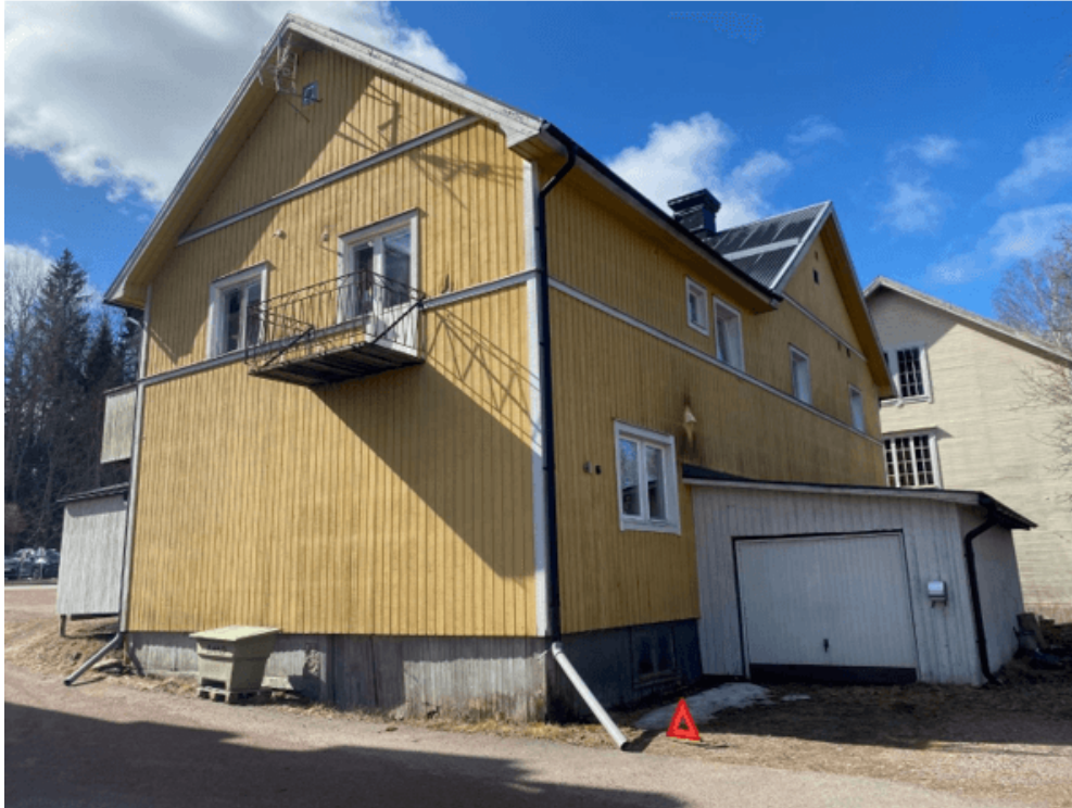
Figur 2: Bornvägen 10 från gården