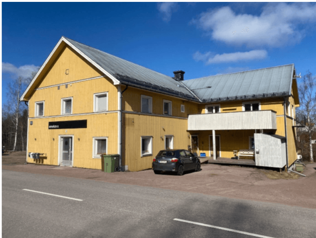
Figur 1: Bornvägen 10, framsidan mot gatan

Berörda delar av fastigheterna utgörs av grusbelagd förgårdsmark samt befintliga byggnader.