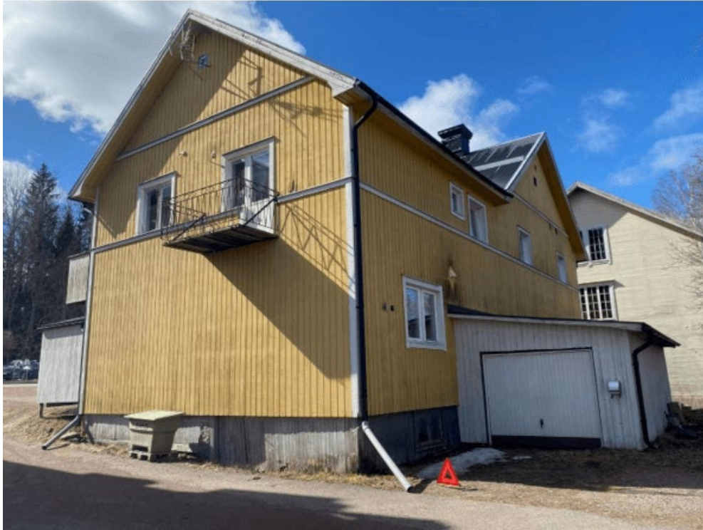
Figur 2: Bornvägen 10 från gården