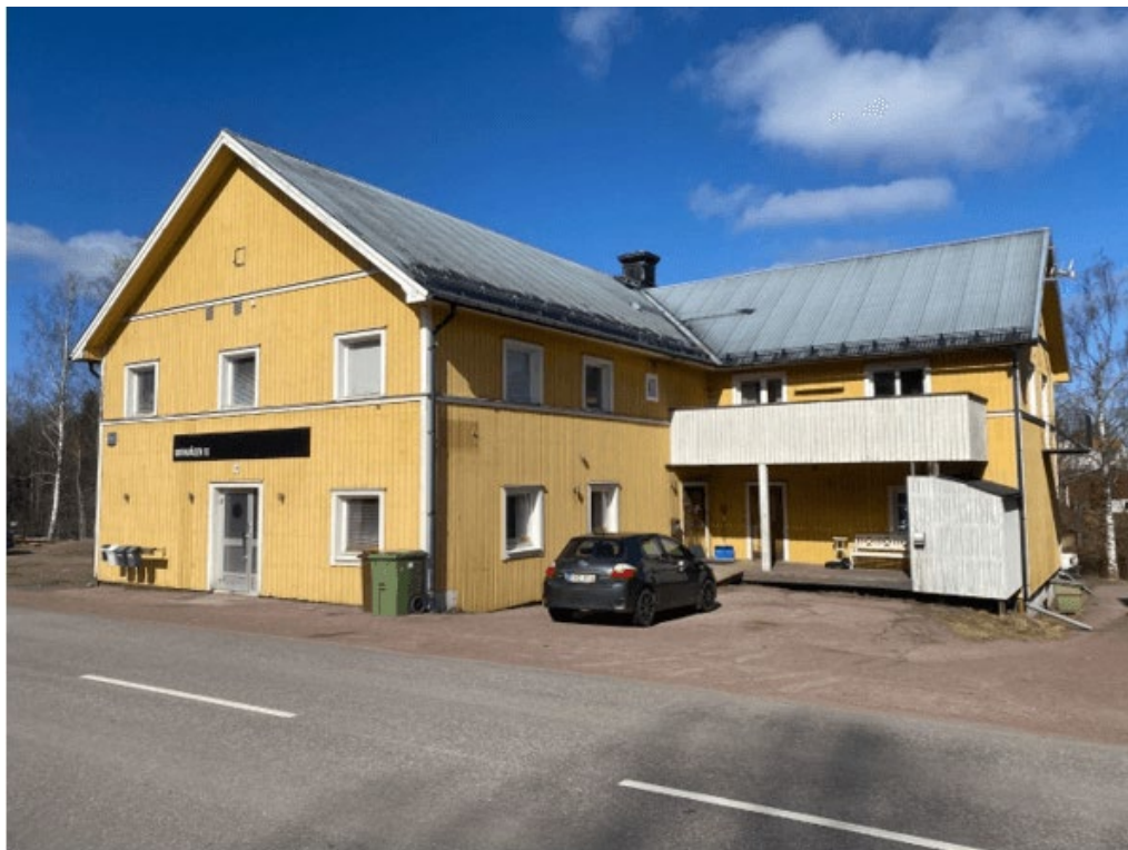
Figur 1: Bornvägen 10, framsidan mot gatan

Berörda delar av fastigheterna utgörs av grusbelagd förgårdsmark samt befintliga byggnader.